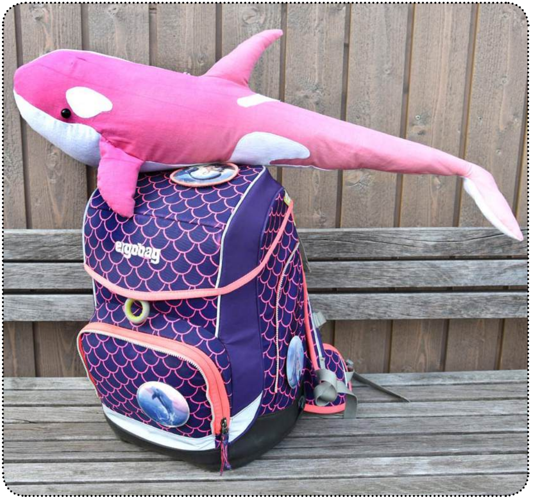
genäht mit 75 % Verkleinerung